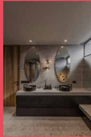
Proyecto Pangea Ubicación Ciudad de México, México Área diseñada 317 m 2